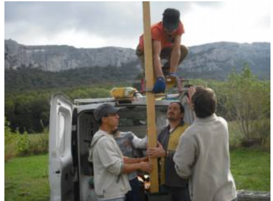
Ça va marcher. Il y a du génie dans cette tête de Sauveur !