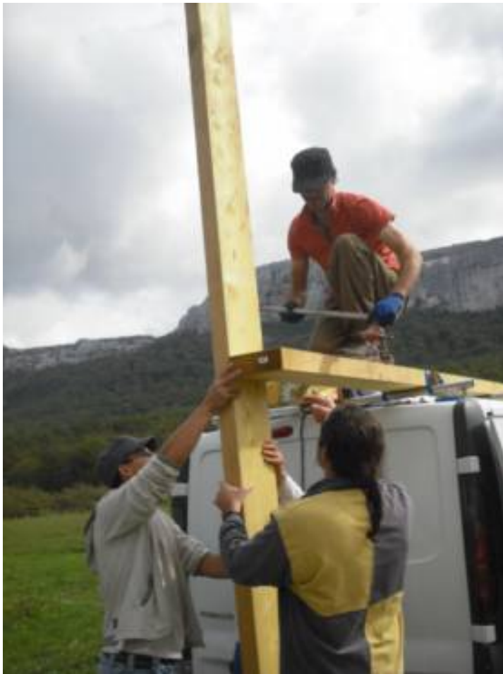
Deux demi madriers à l'équerre tenus par serre joints, dont un tenu sur le toit