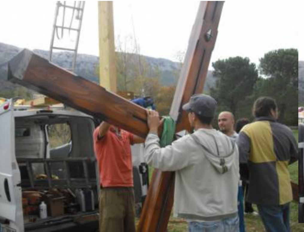
Accrochage de la Croix au câble du treuil