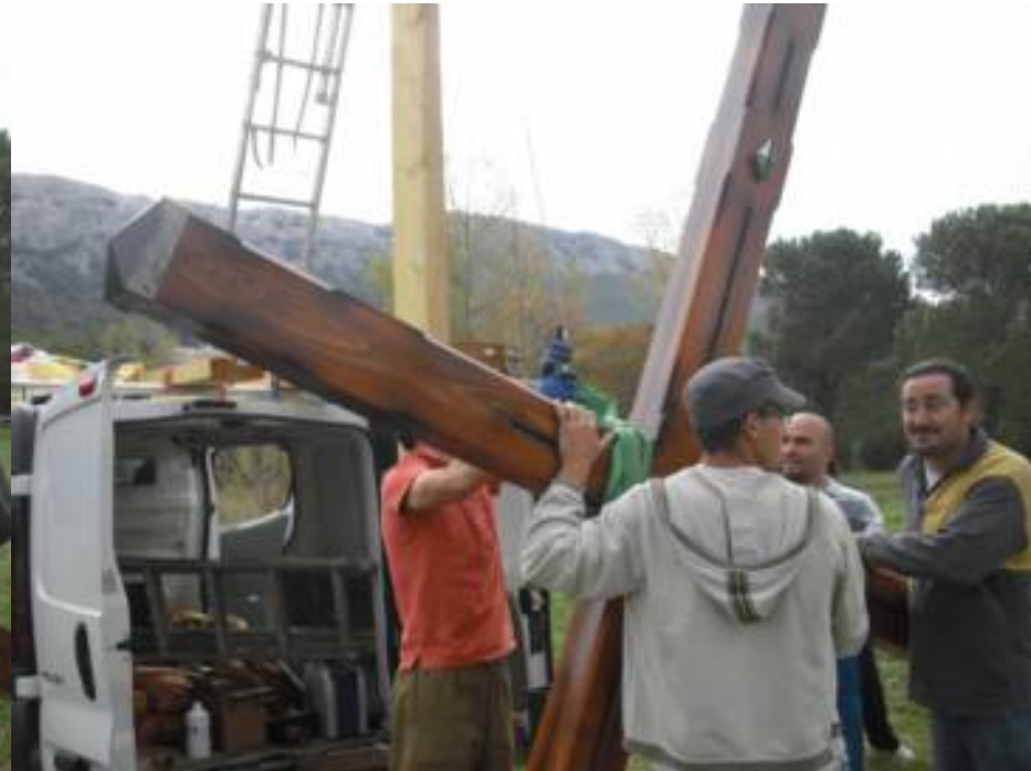
Une dernière vérification de l'arrimage au câble du treuil.