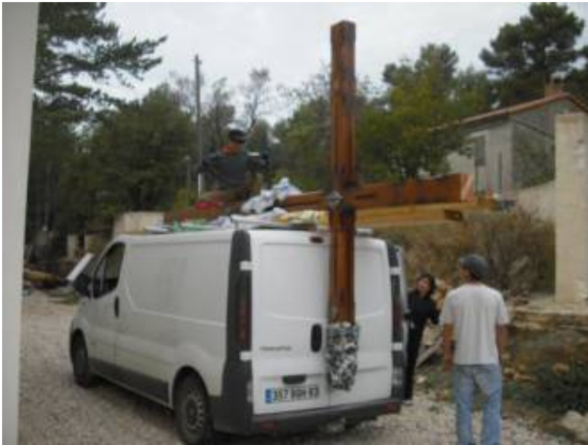
L'art du chargement !