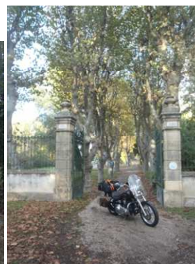
Vous êtes arrivés