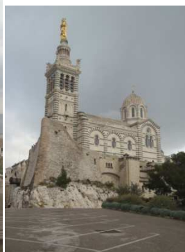
Parking Rdv le 1 er mai