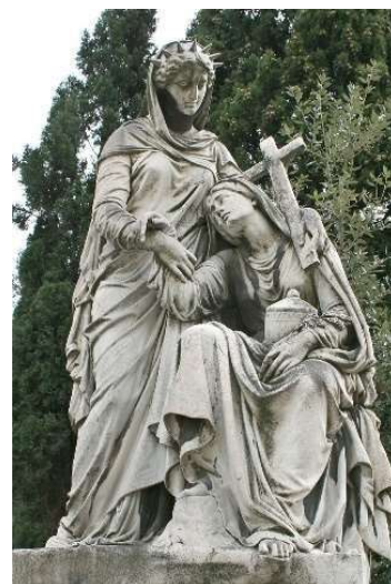
la Religion consolant la Douleur

Le chemin longe alors l'Huveaune qui fut jadis le chemin suivi par Marie-Madeleine pour se rendre à la Forêt sacrée. Toutefois, les pèlerins s'en écarteront car les rives du fleuve, en amont d'Auriol notamment, sont devenues instables et souvent encombrées ; et les pèlerins préférant visiter les sanctuaires et traverser les "déserts" du Massif. Mais pour l'heure, les marcheurs atteignent bientôt Saint-Marcel puis la Penne-sur-Huveaune.