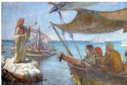
"Marie-Madeleine prêchant les Marseillais"

L'Hostellerie est un petit monde en soi. Construite au milieu du XIX e siècle par le père Henri Lacordaire pour remplacer celle attenante à la Grotte détruite durant la Révolution, l'établissement comprend, outre